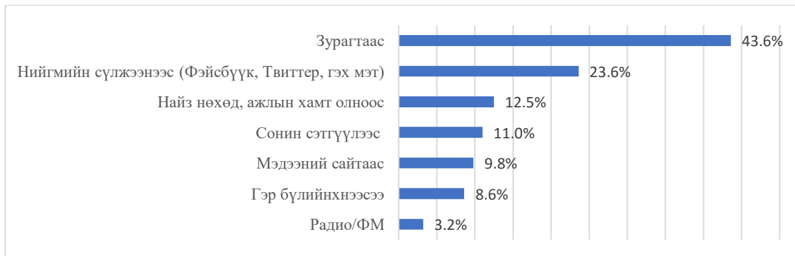
Зураг 5.Зураг 3. Мэдээллийн эх сурвалж нийт оролцогчдоор, хувиар

Монгол Улсын хувьд цахим аюулгүй байдлыг хангах чиглэлээр эрх зүйн орчин бүрдүүлэн ажиллаж байна.