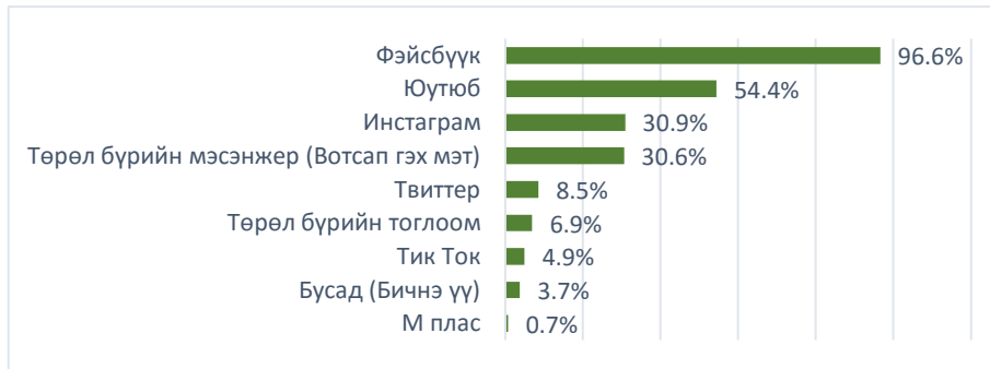
Зураг 4.Тогтмол ашигладаг аппликейшн нийт оролцогчдоор, хувиар