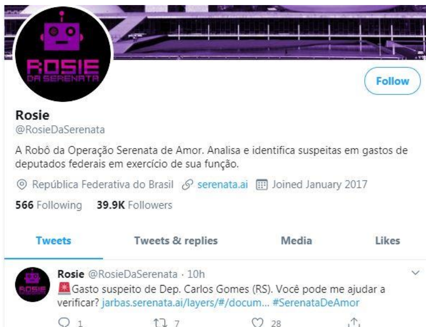
Зураг 2. Бразилийн Засгийн газрын төсвийн хөрөнгийн зарцуулалтыг хиймэл оюуны тусламжтай нягтлан шалгах "Хайрын дуулал" нэртэй төслийн бий болгосон бот