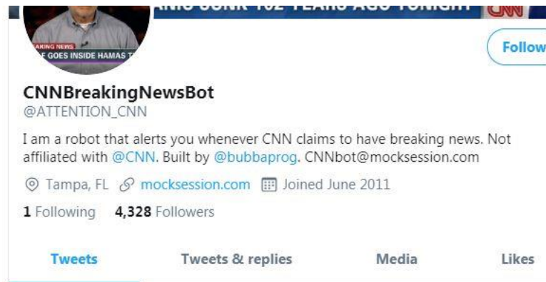
Зураг 1. CNNBreakingNewsBot